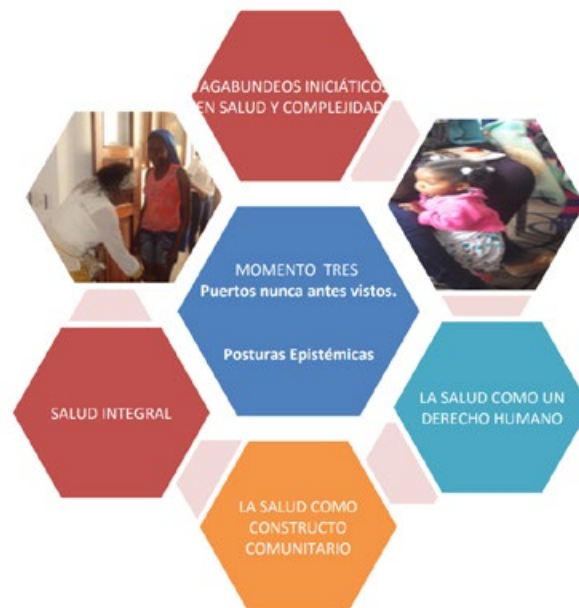
Hologramía: Fuente Autor