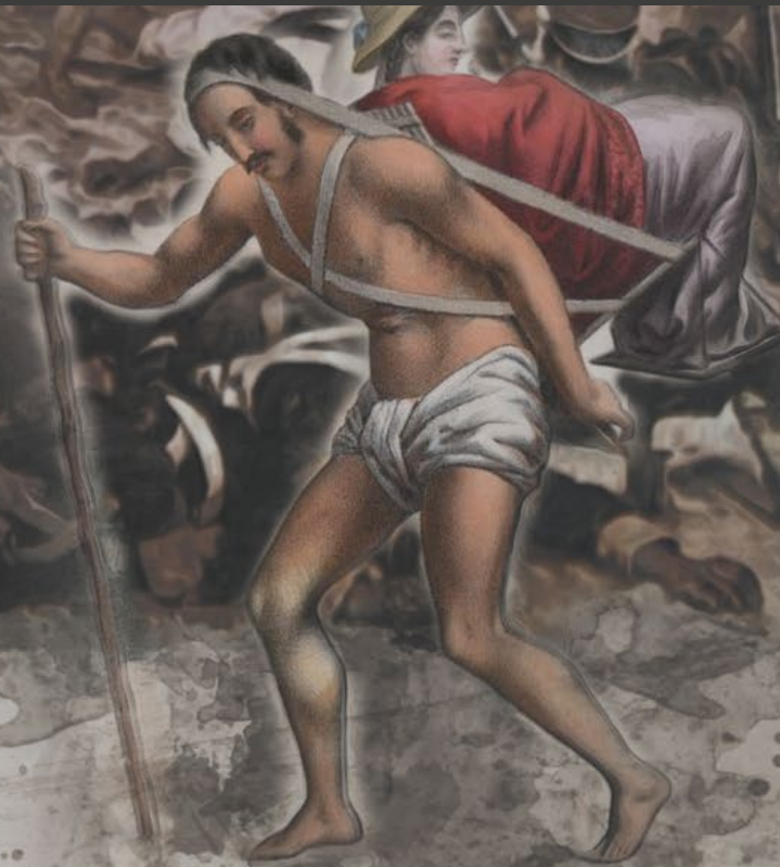
Ilustración basada en obras de A. Delarue y Martín Tovar y Tovar