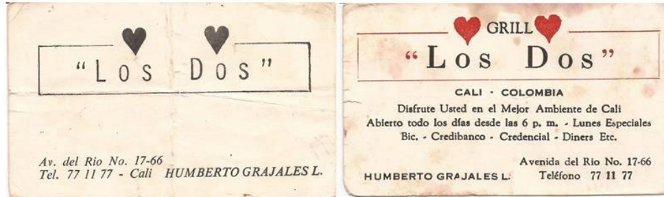
Figura N° 2. Tarjeta de presentación del Grill Los Dos

Fuente: Archivo Junio Unicidad, Tarjeta de presentación del Grill Los Dos, espacio de homosocialización.