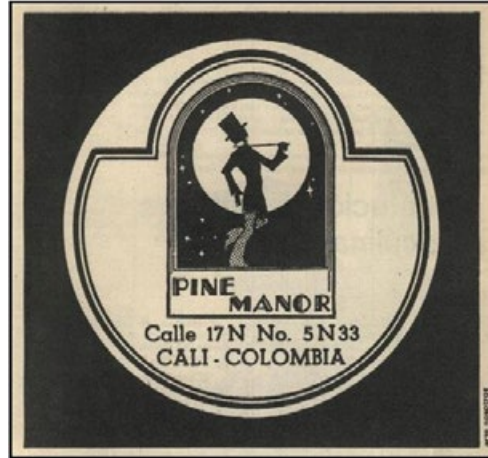
Figura N° 3. Bar Pine Mano

Portavaso con el logo de bar Pine Mano.