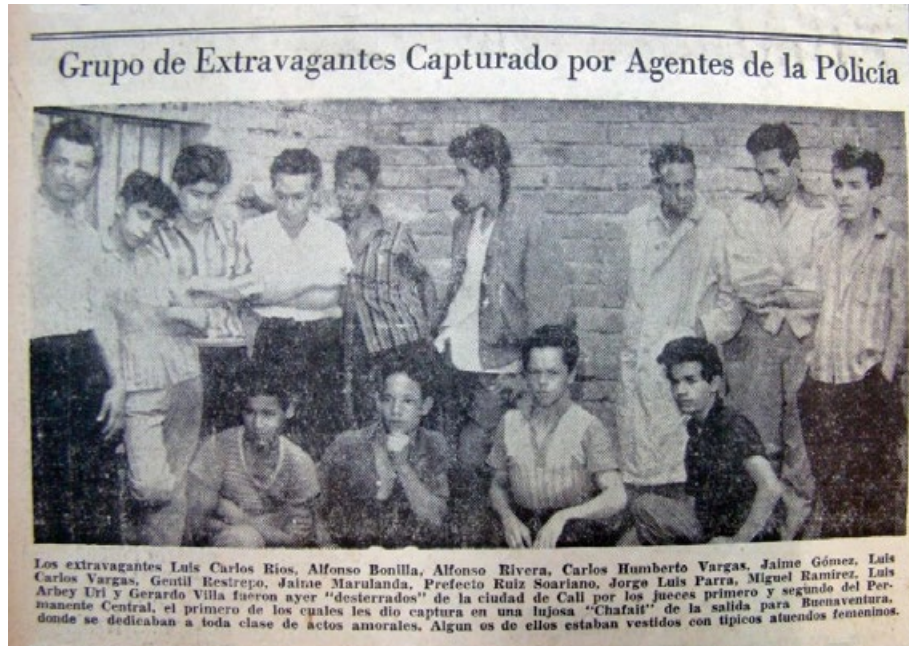
Figura 1. Grupo de extravagantes capturados por agentes de la policía